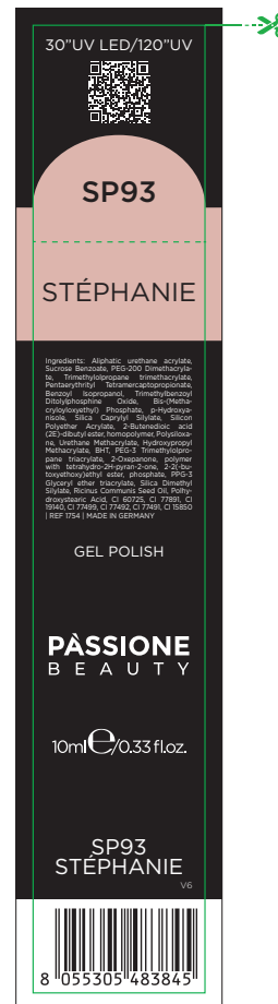
Etichetta Scatola / Box Label