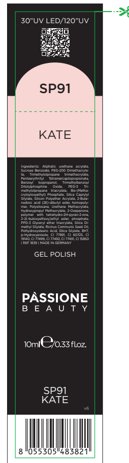
Etichetta Scatola / Box Label