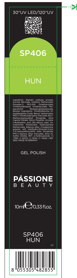
Etichetta Scatola / Box Label