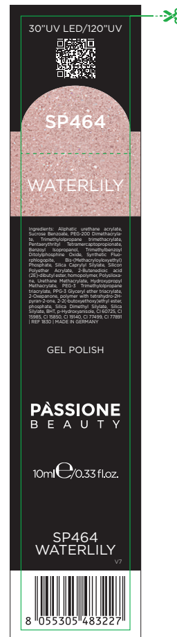
Etichetta Scatola / Box Label