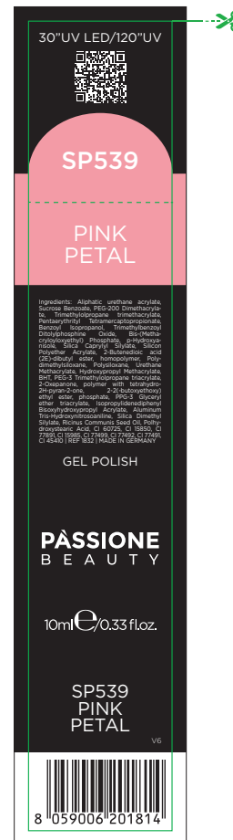
Etichetta Scatola / Box Label