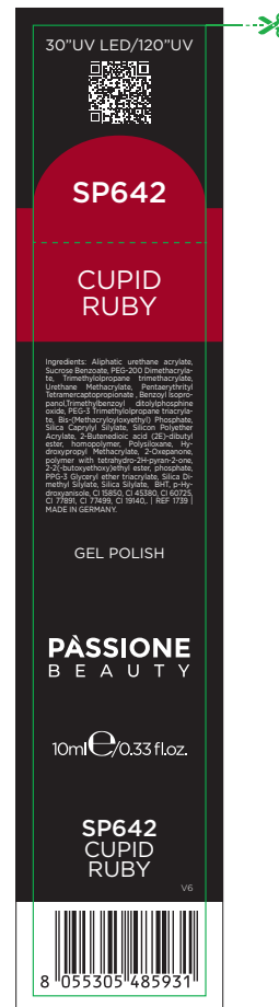
Etichetta Scatola / Box Label