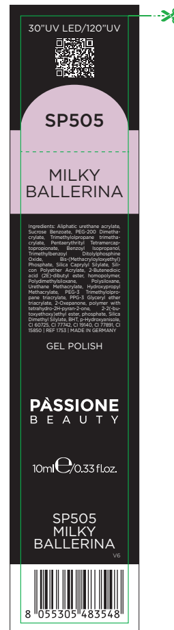
Etichetta Scatola / Box Label