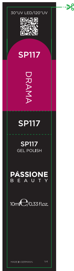
Etichetta Flacone / Product Label