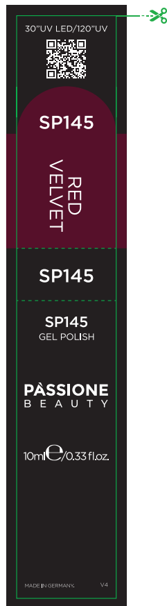
Etichetta Flacone / Product Label