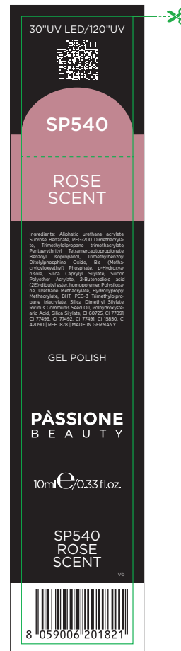
Etichetta Scatola / Box Label