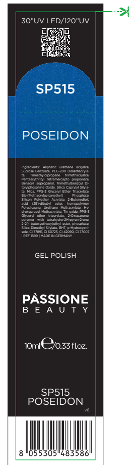
Etichetta Scatola / Box Label