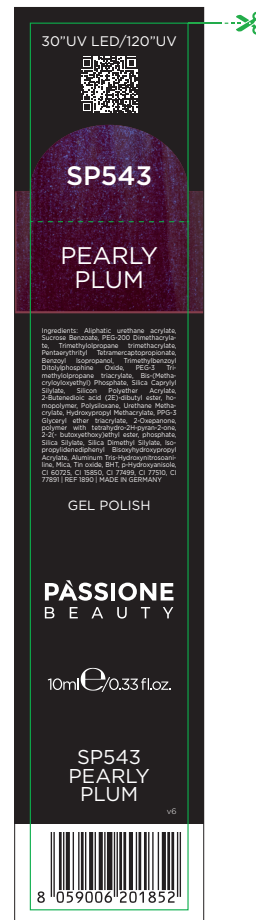
Etichetta Scatola / Box Label