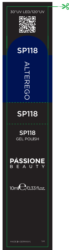
Etichetta Flacone / Product Label