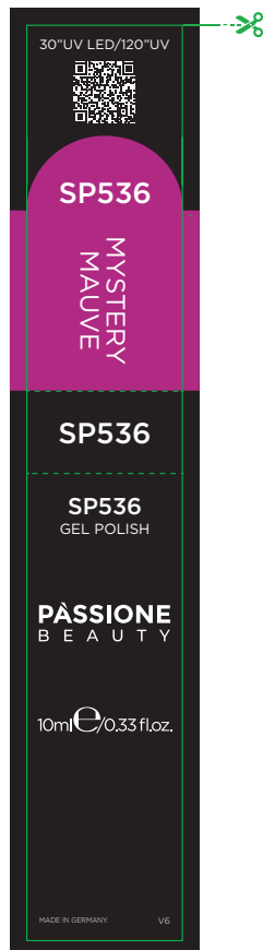
Etichetta Flacone / Product Label