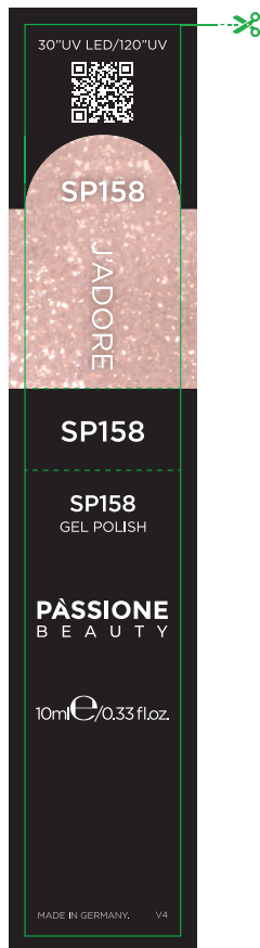
Etichetta Flacone / Product Label