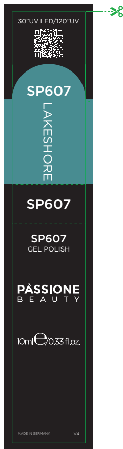
Etichetta Flacone / Product Label