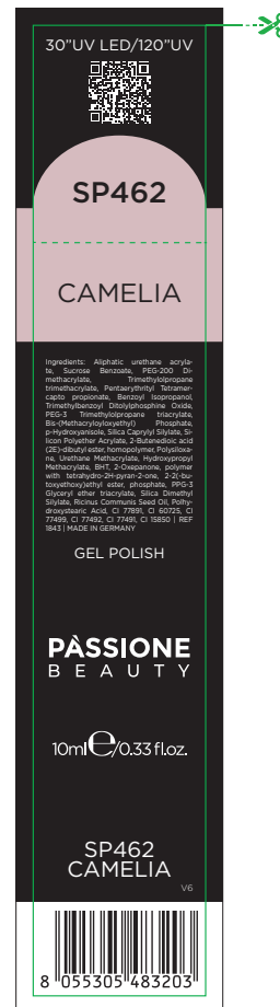
Etichetta Scatola / Box Label