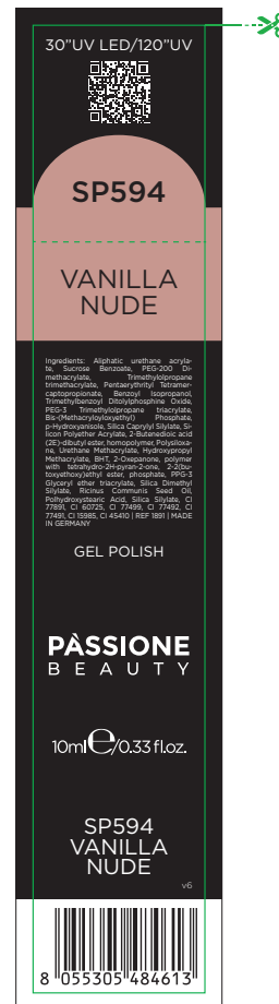
Etichetta Scatola / Box Label