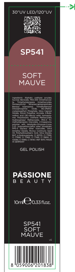
Etichetta Scatola / Box Label